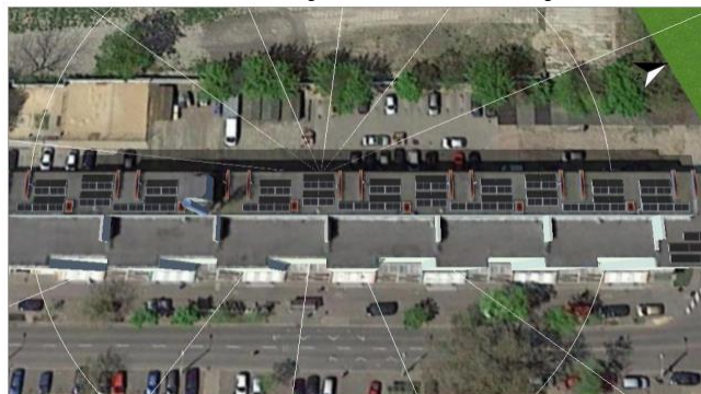
Ilustracja: 3. Powierzchnię modułu - Dowolny obiekt 3D 01-Wielkość generatora Południowy-Wschód

W związku z rosnącymi cenami energii, a także możliwościami uzyskania dofinansowań do instalacji fotowoltaicznych na preferencyjnych warunkach, Spółdzielnia Mieszkaniowa Lokatorsko-Własnościowa „Rolna” we współpracy z firmą SolarSpot postanowiła przygotować wniosek o pozyskanie finansowania na dostawę, montaż i uruchomienie instalacji fotowoltaicznej.