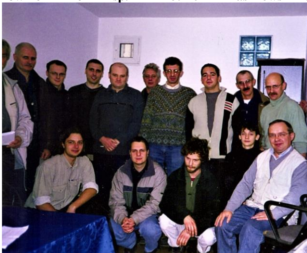
Zebranie założycielskie INROL-u – zdjęcie z 2003 roku