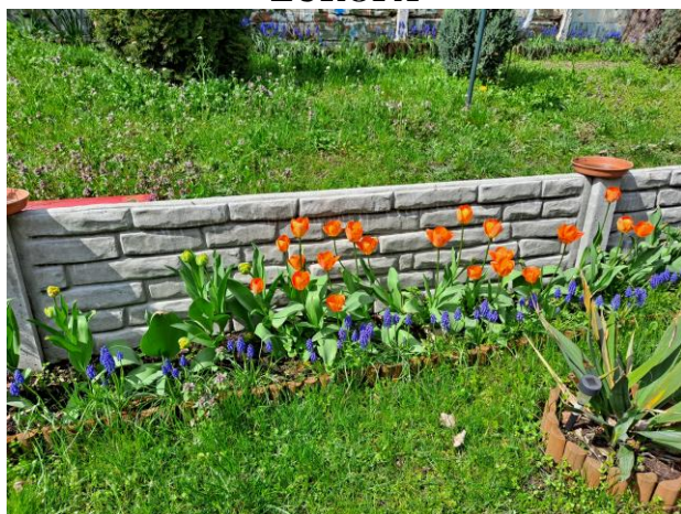
Na Topolowym Fyrtilu kwitną nie tylko topole. Dziękujemy złotym rączkom naszych Seniorów

Nasi mieszkańcy mogą wynająć pomieszczenie Schronu Kultury Europa (odpłatnie) lub teren Topolowego Fyrtila łącznie z grillem