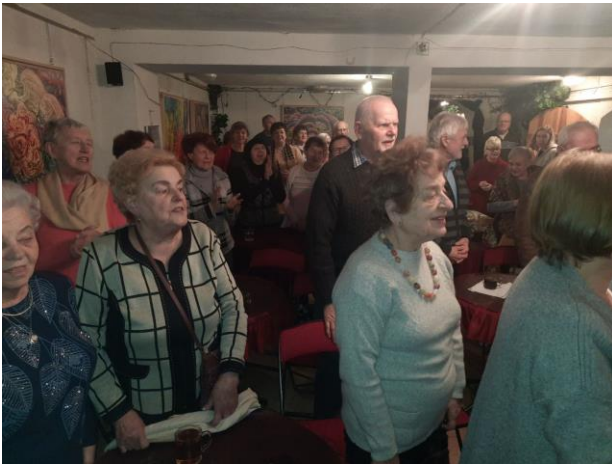
Podczas jednego ze spotkań śpiewankowych”